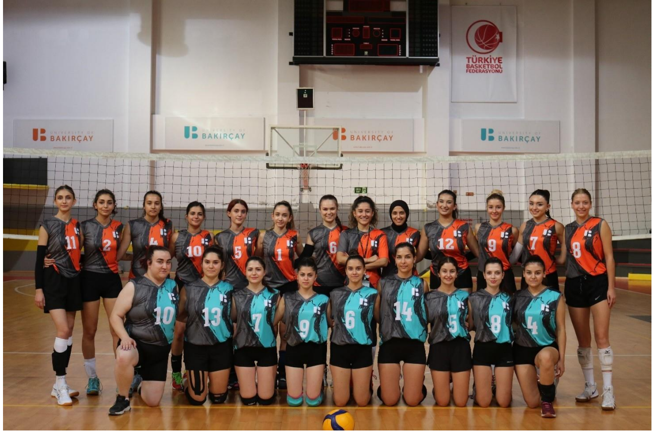
Tablo 27: 2024 Personel Turnuvaları Verileri